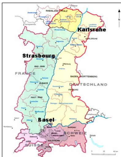
Grundlagen : SIGRS / GISOR 2009