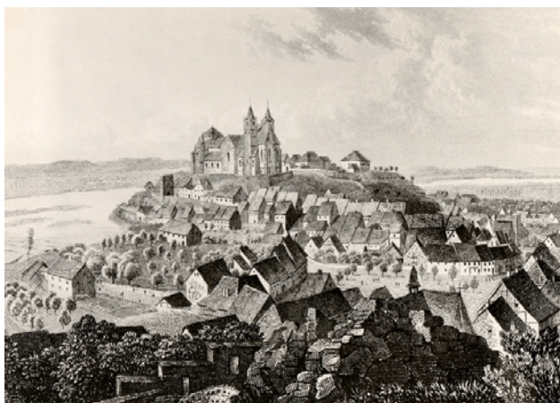
Vieux Brisach Eau-forte, “Topographia Alsatiae”, 1663

L’Alsace, une histoire, sous la direction de B. Vogler, éditions Oberlin 1990.