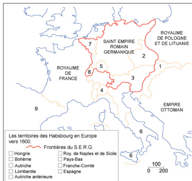
Les territoires des Habsbourg en Europe vers 1600 Dessin Giulio Tosca (LMZ-RP)