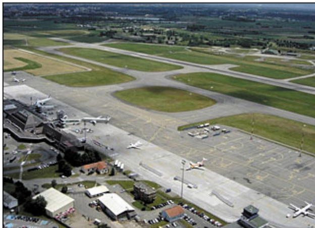
Der Flughafen von Strasbourg

Lorsque Jean a fini de raconter, le maître lui demande de retracer au tableau les différentes étapes du voyage.