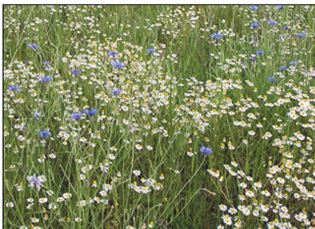
Natürliche Wiese