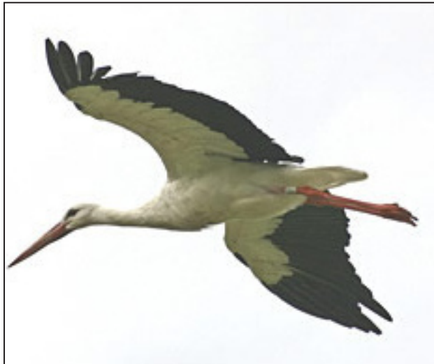
Storch im Flug

Früher waren die Storchzüge Vorboten der Jahreszeiten. Im August, wenn sie sich auf ihre lange Reise nach den südlich der Saharawüste liegenden Ländern Afrikas vorbereiteten, war es ein Vorzeichen des Herannahens der schlechten Jahreszeit. Auch nach einem strengen Winter belauerten die Dorfbewohner ungeduldig ihre Rückkehr. Wenn die Störche im März wieder erschienen, war der Frühling sicher nicht mehr weit.