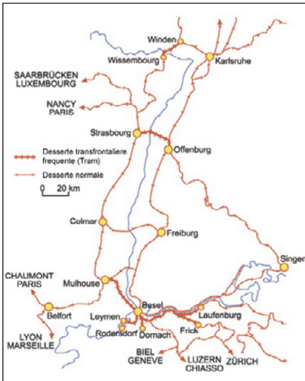
Regionale und internationale Eisenbahnverbindungen im Oberrheingebiet Zeichnung Giulio Tosca (LMZ-RP)

In den drei Ländern des Oberrheinraums betreiben drei verschiedene Gesellschaften den Eisenbahnverkehr.